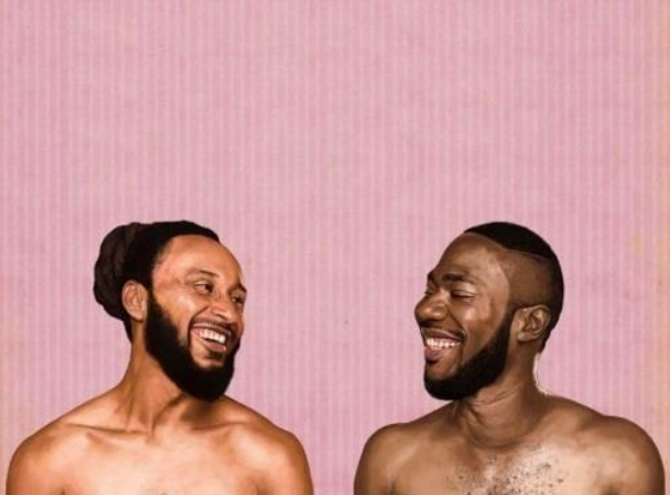
FOKN BOIS DRUMMERS